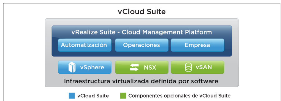
Figura 1: Productos integrados en vCloud Suite

Los productos de gestión de la cloud de VMware vRealize están integrados también de forma nativa en el SDCC de VMware: VMware vSphere, VMware NSX® y VMware vSAN™. Las estructuras de NSX, como enrutadores virtuales, equilibradores de carga y cortafuegos, pueden incrustarse en una plantilla de servicio (modelo) creada en vRealize Automation que se puede modificar y de la que se pueden crear instancias a petición en el contexto de la aplicación en ejecución, en función de las necesidades de la empresa.